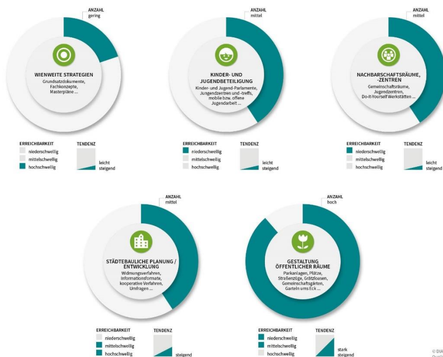
Abbildung 2: Charakteristika verschiedener Partizipationsangebote in Wien